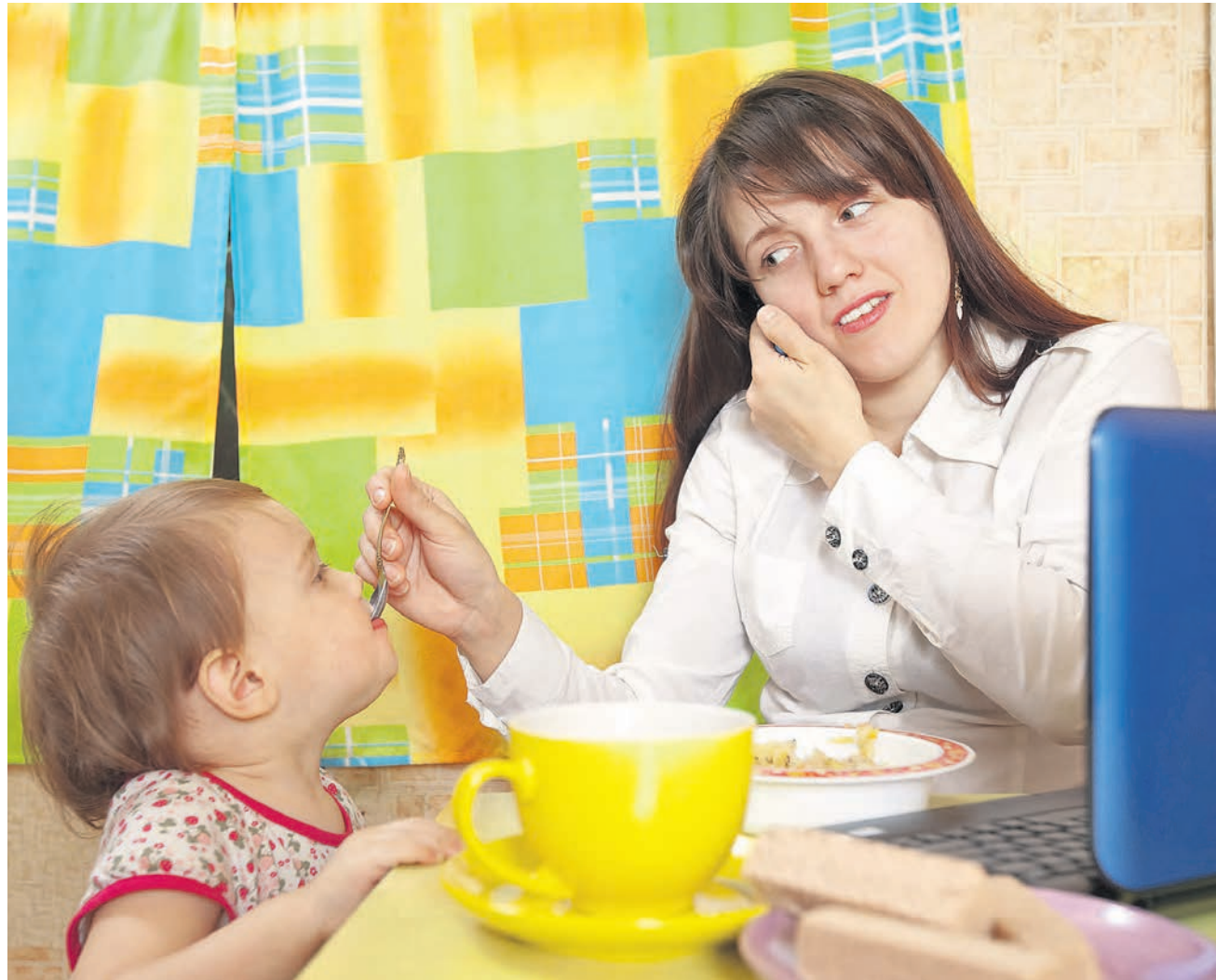
Sachzwänge. Die Realität verlangt von Frauen oft, dass sie Familie und Beruf unter einen Hut bringen.

Die familienexterne Kinderbetreuung ist in der Schweiz für den gut qualifizierten Mittelstand im internationalen