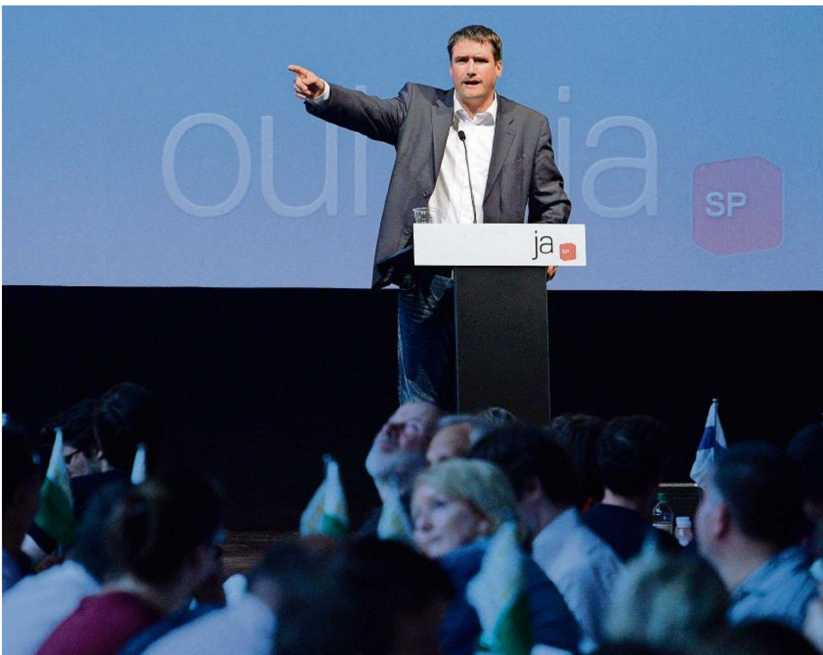
Muss mit seiner Partei viele Rückschläge hinnehmen: SP-Parteipräsident Christian Levrat.